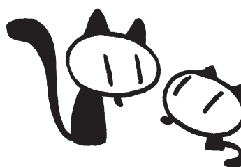
Le Fauve © Lewis Trondheim / 9 e Art +